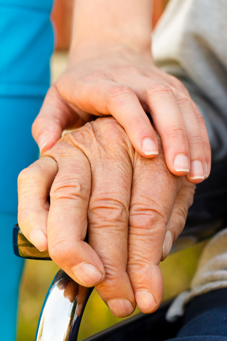
Mødet mellem rådmanden og afdelingsformanden lagde op til, at dialogen og debatten om forholdene i ældreplejen fortsætter.